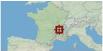
Plan de situation : Carte IGN au 1/25000 de la localisation