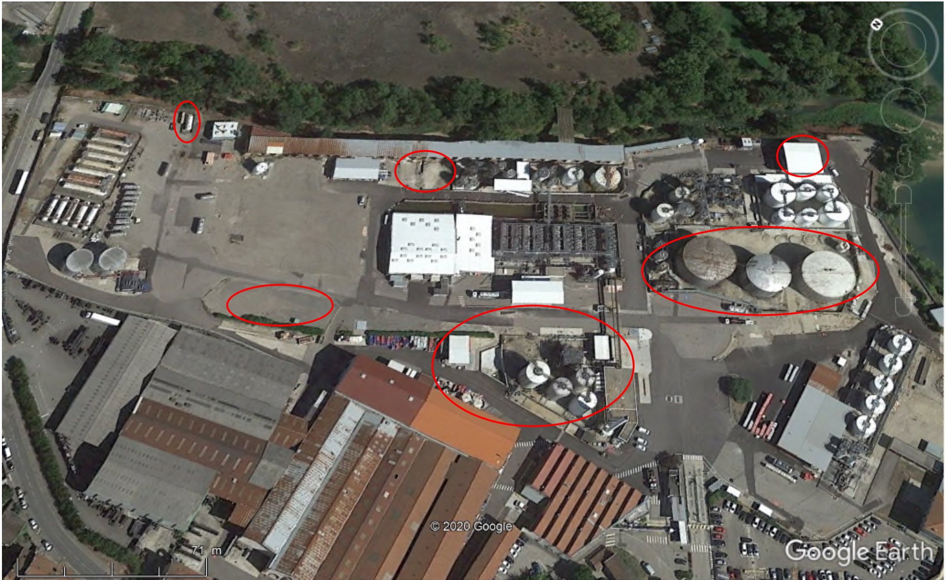
Plan du projet